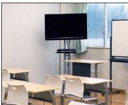
公立中学校設置例